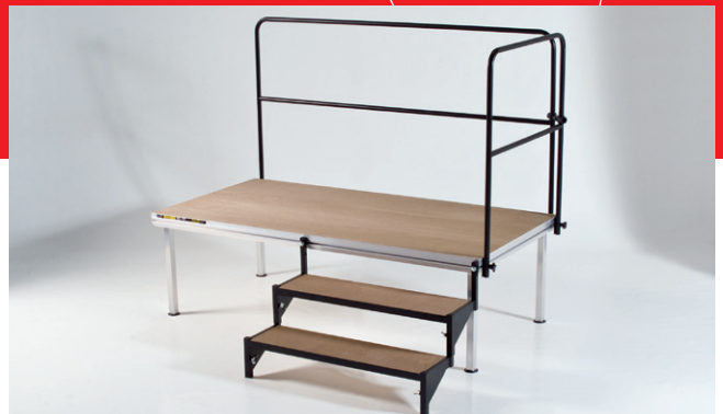
Bühnengeländer und -treppen