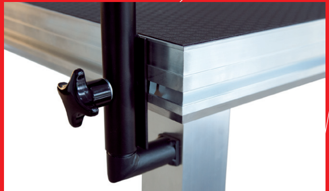
Geländerbefestigung mit Hilfe von Nutensteinen