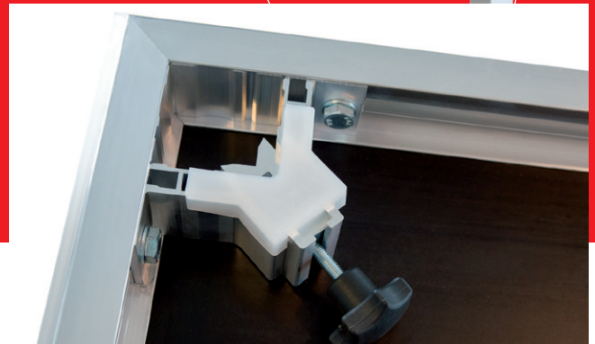
In der variablen Podestecke sind die Füße in Sekundenschnelle montiert.