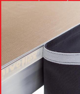
Textil- oder Holzverblendung