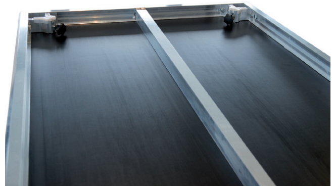
Große Stabilität wird durch einen Unterzug erreicht.